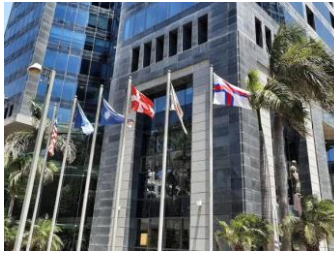
Mynd 1. Sendistova Føroya í Ísrael varð sett á stovn í 2020

Tørvur er av og á, at greiða nærri frá ymsum viðurskiftum, sum fara fram í Ísrael, ið kunnu hava áhuga í Føroyum. Ísrael er á ymsum økjum annarleiðis enn tey lond, sum vit vanligi samanbera okkum við og har vit hava sendistovur. Sendistovan hevur sett sær fyri, at kunna um hesi viðurskifti. Hetta er fyrsta kunningarrit, sum kemur frá Sendistovu Føroya í Ísrael og hava vit valt at leggja dent á tey viðurskifti, sum vit halda er mest viðkomandi.