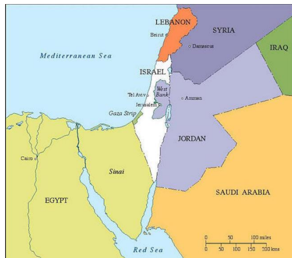
Mynd 2. Ísrael er umgirt av fleiri grannalondum, men hevur lítlan samhandil við tey. Tí hyggja ísraelar aðrar leiðir.

Tað, sum sermerkir Ísrael er, at hóast tað bógva út við 10 mió. fólk, so verður heima-marknaðurin mettur at verða ov lítil. Møguleikarnir fyri at kunna útflyta til grannalondini er eisini avmarkaður, tí samhandilin við tey hava sínar serligu avbjóðingar. Tí er vinnan og innovatiósumhvørvið sera tilvitað um, at marknaðurin er oftani fyrst og fremst uttanfyri Ísrael. Tí eru ísraelskar fyrirkur og innovatiósumhvørvi lætt at samskifta við og hevur góðar eginleikar at skilja støðuna og møguleikarnir uttanfyri Ísrael. Tað er har teirra gerandisdagur er.